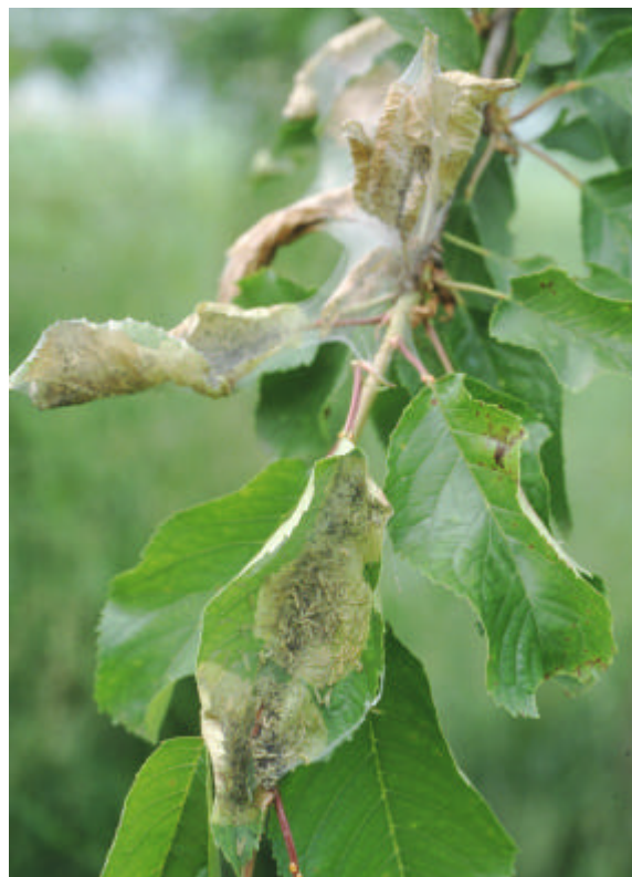
Giovani larve di ifantria

Il nome volgare "webworm" usato nel suo paese d'origine deriva da web = tela e worm = bruco.