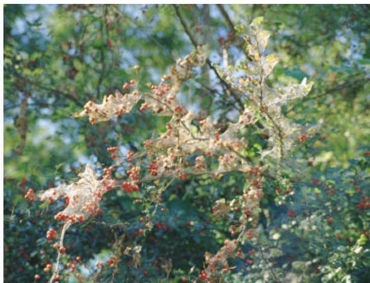
Tela sericea di ifantria su biancospino