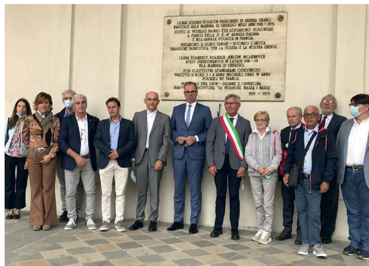
La cerimonia di commemorazione dei soldati polacchi a Palazzo Santa Chiara.