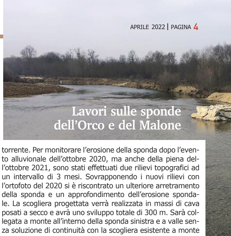
Lavori sulle sponde dell'Orco e del Malone