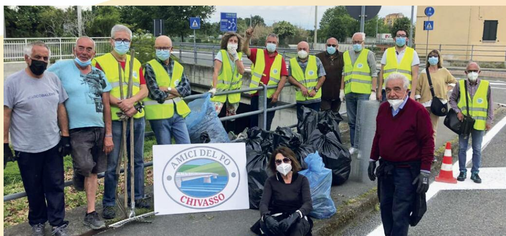
Pulizia del tratto del Rio Orchetto degli Amici del Po Chivasso.