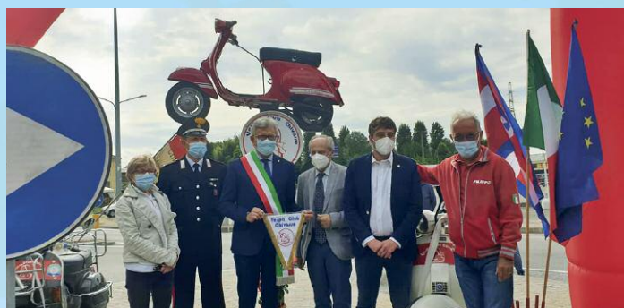
Inaugurazione del monumento alla vespa.