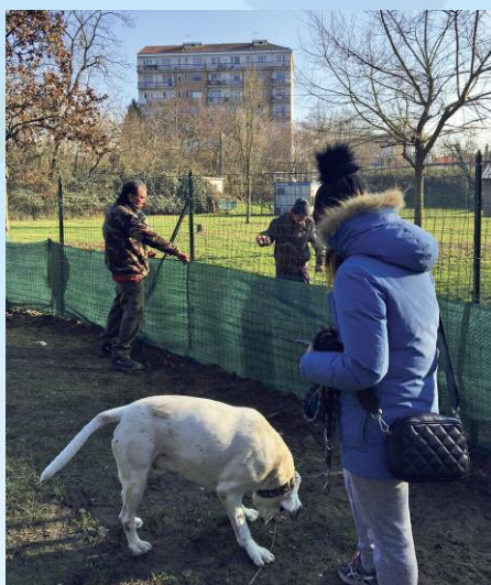
Azioni migliorative dell'area cani nel parco del Mauriziano.

comunale rende nota attraverso un avviso pubblico. La proposta – da indirizzare allo Sportello per i beni comuni – deve contenere una descrizione dell'idea progettuale e degli obiettivi che si intendono raggiungere, la durata del-