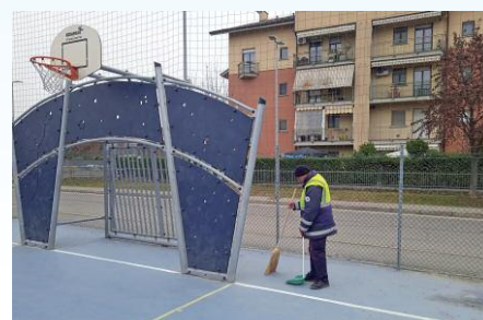
Custodia e pulizia del campo da pallacanestro di via Favorita.

laborare, avendo cura di ciò che appartiene alla collettività». «L'obiettivo – ha aggiunto l'assessore comunale Pasquale Centin – è facilitare l'alleanza tra chi lavora nell'amministrazione pubblica, i cittadini e le realtà del terzo settore. Un risultato che si costruisce giorno dopo giorno, attraverso la capillare e continuativa attività divulgativa, formativa, di accompagnamento progettuale, ma anche di sperimentazione sul campo; il tutto con un ruolo attivo di cittadini e associazionismo». Timidamente partiti nel 2016, lo scorso anno ha stabilito un incremento esponenziale dei Patti di Collaborazione. Nel 2021 infatti, sono state 9 le iniziative, triplicate rispetto al 2019, non volendo tenere conto dell'anno di prima comparsa della pandemia. Tra esse, l'Associazione Nazionale Bersaglieri si è occupata di restituire decoro alle lapidi poste sotto il porticato del palazzo comunale e rendere meglio leggibili le loro incisioni, in modo da custodire e tramandare la memoria delle persone che hanno dato la vita nei vari conflitti e la memoria degli eventi, anche drammatici, che hanno segnato la storia della nostra comunità. L'Associazione Amici del Po Chivasso ha invece provveduto