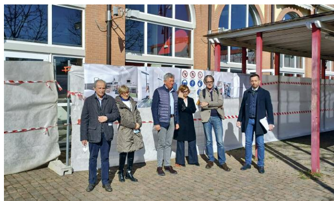
L'apertura del cantiere del Movicentro.

Sono partiti i lavori per adeguare i locali del Movicentro per servizi di biblioteca. Il progetto, per un quadro economico di 450 mila euro e 4 mesi di durata, prevede l'efficientamento energetico dell'edificio e la rifunzionalizzazione degli spazi interni. Al piano terra verranno ricavati due grandi ambienti comunicanti destinati ad