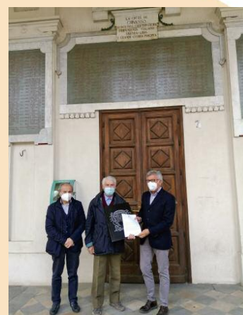
Pulizia delle incisioni delle lapidi di Palazzo Santa Chiara da parte dell'Associazione Nazionale Bersaglieri.