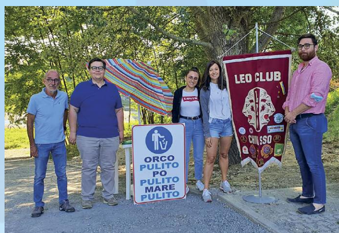
L'iniziativa Orco pulito, Po pulito, mare pulito degli Amici del Po Chivasso.